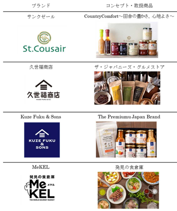
図 1 サンクゼールブランドとコンセプト 3

サンクゼールは 1975 年に斑尾高原でペンションの経営を開始し、ペンションで提供していた手作りジャムが好評であったことから、1982 年に法人を設立してジャムの製造販売を本格化させ、2022 年 12 月に東京証券取引所グロス市場へ上場した。マーケティング、製商品の企画・開発、調達・製造、店舗設計、販売までのプロセスを全て自社で一気通貫して手掛けることで独自のグロッサリーストアを作り上げており、4 つの異なるブランドコンセプトで幅広い顧客層を獲得している。