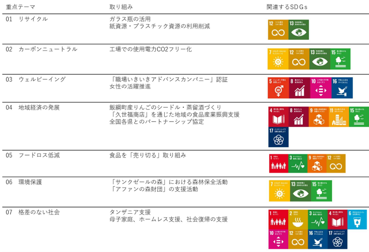
図3 サンクゼールのマテリアリティと取り組み 6

サンクゼールは、事業活動を通じて、より多くの人に「愛と喜びのある食卓」を長期持続的に提供することを目指して、サステナビリティの推進を重要な経営課題と位置づけ、7つのマテリアリティを特定してそれぞれ課題に対しての取り組みを行い、2035年までに目指す姿として「ビジョン 2035」を設定した。「ビジョン 2035」では、2035年の世界における人々の生活を具体的に想定し、その中でサンクゼールは消費者と真摯に向き合って商品を提供しながら、多くのパートナー企業とそれぞれの強みを発揮しながら地域の活性化に貢献し、生き生きと働く社員たちの姿を具体的に描いている。「ビジョン 2035」を通じてサンクゼールが目指す方向性を公に示すことで、ステークホルダーと共にサステナビリティへの取り組みを加速させていく方針である。